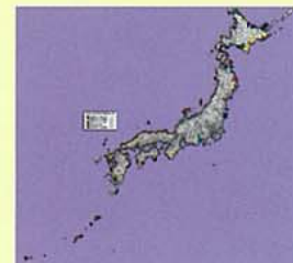
活性化指標による全国マップ