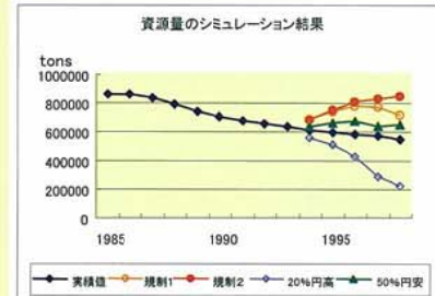
資源量のシミュレーション結果