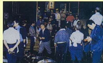
全国の産地市場からの荷が集まる築地市場