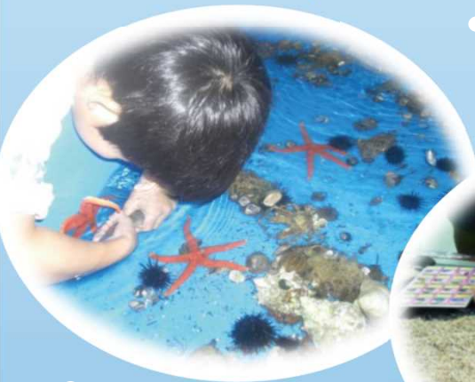
生き物に触れる！ タッチプール