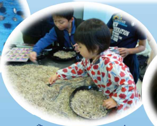
君だけのモンスター探し！ チリメンモンスター