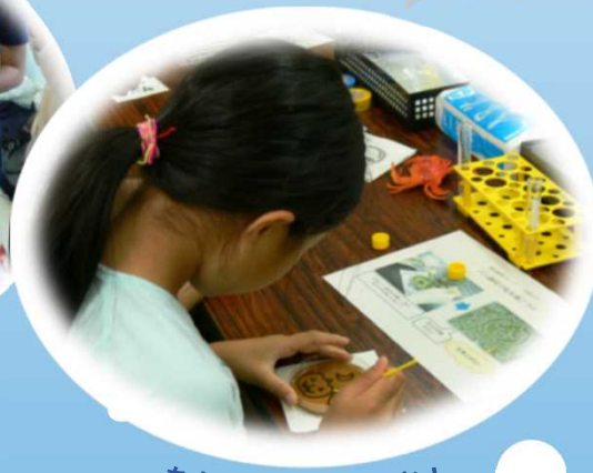
あなたも1日研究者！ 参加型ラボツアー